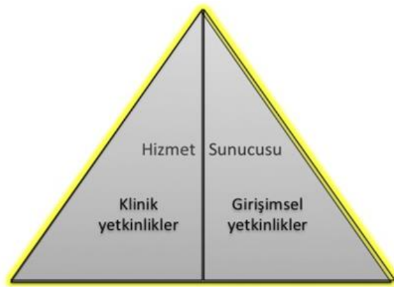
Şekil 2- TUKMOS yedinci temel yetkinlik alanı: Hizmet Sunucusu

Girişimsel Yetkinlik: Bilgiyi, kişisel, sosyal ve/veya metodolojik becerileri tıbbi girişimler konusunda kullanabilme yeteneğidir.