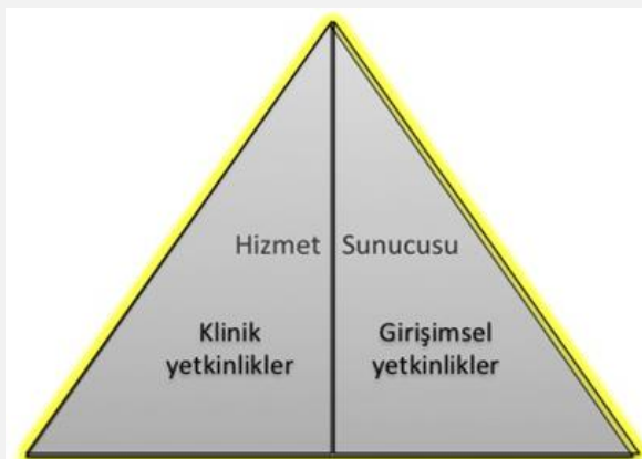
Şekil 2- TUKMOS yedinci temel yetkinlik alanı: Hizmet Sunucusu

Girişimsel Yetkinlik: Bilgiyi, kişisel, sosyal ve/veya metodolojik becerileri tıbbi girişimler konusunda kullanabilme yeteneğidir.